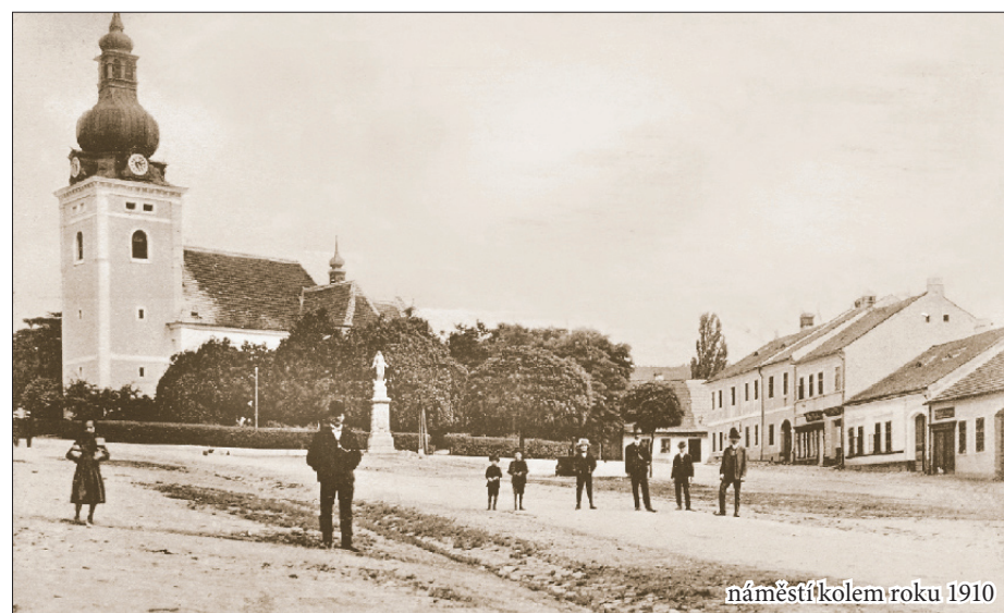
náměstí kolem roku 1910