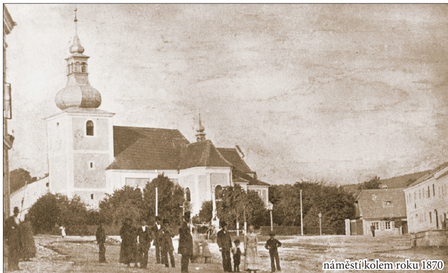
náměstí kolem roku 1870

či podobné veřejné plochy. Stačí vzpomenout na brněnský Zelný a Obilný trh, také třeba honosný bulvár v centru Vídně je dodnes Uhelným trhem. Označení funkce těchto ploch tedy mnohdy zvětlilo nad výrazy popisujícími např. jejich tvar či umístění. K pozoruhodnému vývoji však došlo v polštině, kterou postihl proces přesně opačný: původně německý výraz odkazující ke kruhovému tvaru náměstí („rynek“) se stal výrazem