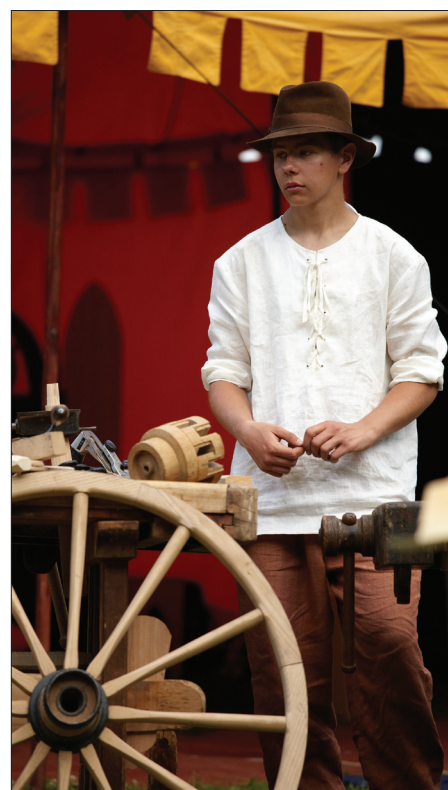
Mladý učeň řemesla kolářského.