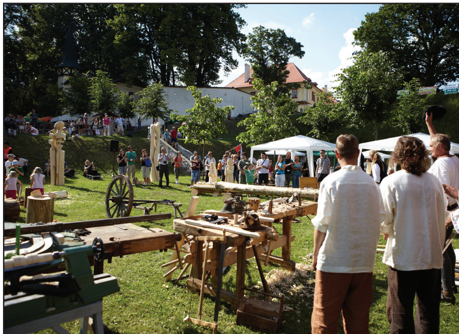
Svátky řemesel byly vyvrcholením dřevařského symposia.

V současné době jsou sochy uloženy k vysychání, během prázdnin budou impregnovány a poté rozmístěny.