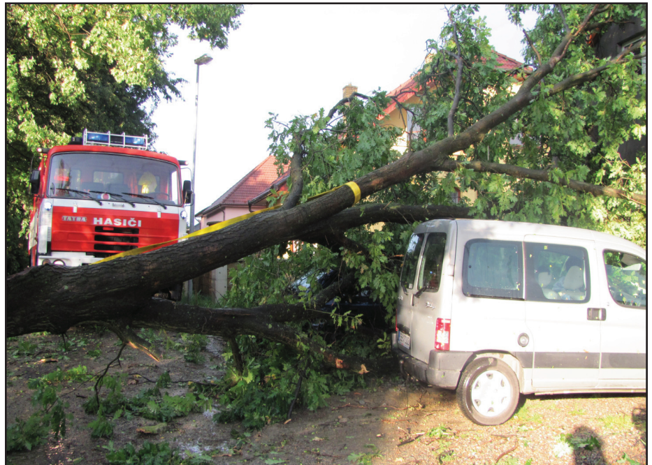
Zásah SDH Kunštát ze dne 19. srpna 2011.

Z důvodu pomoci alespoň nejpotřebnějším, neúspěšným žadatelům o školku, vzniklo v Kunštátu občanské sdružení Kunštátský kulíšek, které s podporou města a školy zajistí na letošní školní rok hlídání předškolních dětí v daném omezeném počtu a zkrácené denní době s výchovným a výukovým programem vycházejícím ze školkového pod dozorem pedagogů. Tento pilotní projekt je také sledován a podporován zástupci JMK a mohl by do budoucna sloužit jako manuál pro podobné akce. V příštích letech dojde k výraznému početnímu odchodu předškoláků. Kromě