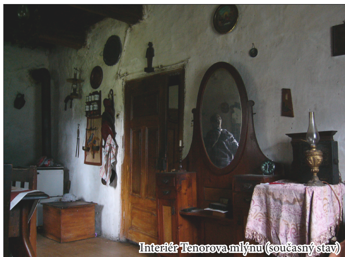
Interiér Tenorova mlýnu (současný stav)

rud s vysokým obsahem kovu (např. krevl z lokality Jezírko u Suché Louky obsahuje více než 60 % oxidů železa), dostatek dřeva