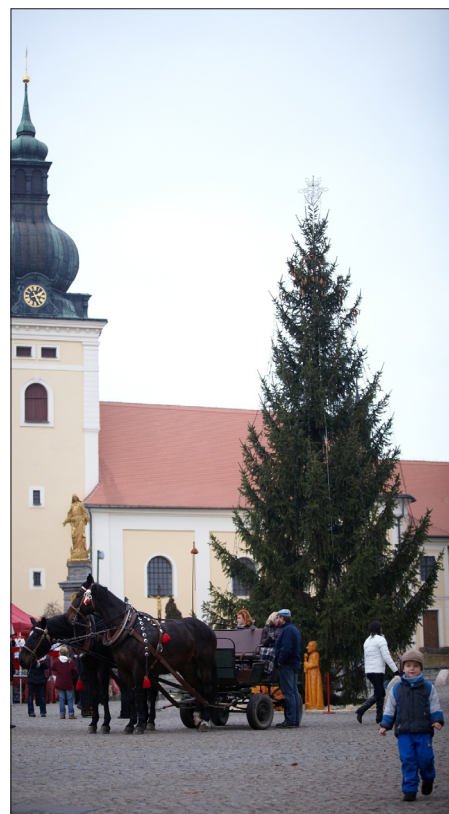
Řemeslný jarmark a rozsvícení vánočního stromu na nám. Krále Jiřího 26. listopadu 2011.