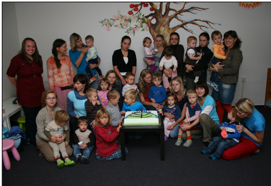
Maminky a děti na oslavě prvních narozenin Chocholíku.

V posledních letech bývalo zvykem sejít se k oslavě příchodu nového roku před půlnocí na náměstí Krále Jiřího, přituknout si s přáteli a zhlédnout ohňostroj. Řada lidí má však jiný silvestrovský program, a tak se těchto oslav zúčastnit nemůže. To byl také jeden z důvodů, proč jsme se v Radě města rozhodli udělat změnu, a to tak, že nový rok přivítáme odpoledne 1. ledna, kdy od 16 hodin zahraje Kunštátská dechovka a v 17 hodin bude následovat ohňostroj. Domníváme se, že kunštátští občané rádi spojí novoroční odpolední procházku s tímto programem, kam budou moci tentokrát vzít i svoje menší ratolesti, které jinak půlnoční ohňostroj nemají možnost vidět.